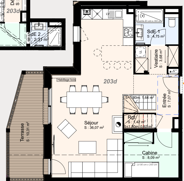
Niveau Entrée : R+2